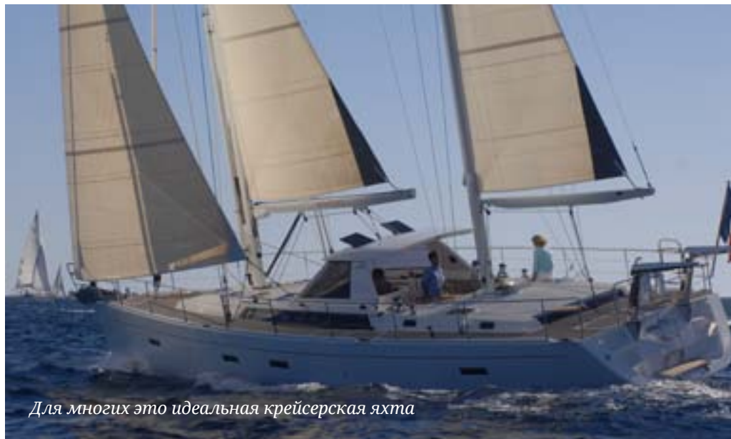
Для многих это идеальная крейсерская яхта

53-футовая Amel Super Maramu 2000 была названа лучшей яхтой 2000 года в Америке и стала абсолютным победителем в номинации яхтенных журналов Cruising World и Sailing World. Специалисты отмечали: «Каждая деталь этой яхты, от киля до клотика, тщательно продумана для использования в дальних плаваниях. Все механизмы могут быть извлечены для ремонта из корпуса через люки; двигатель и аккумуляторы размещены в водонепроницаемом отсеке с вентиляцией, гаран-