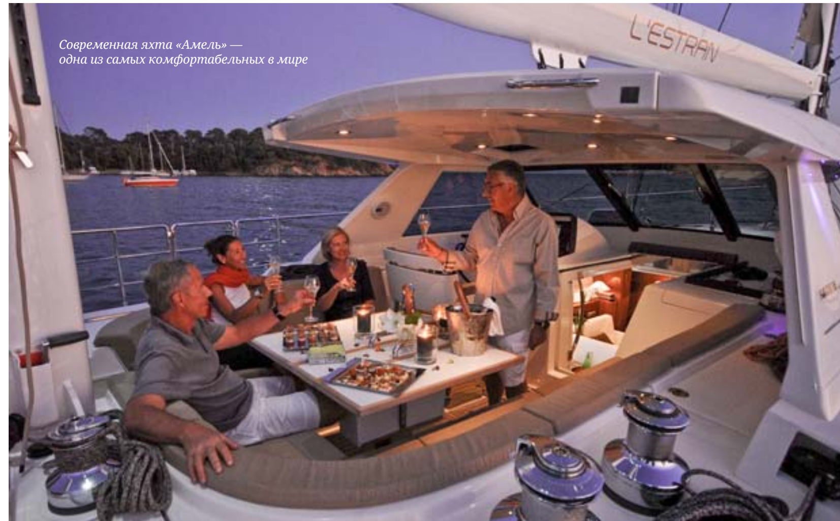
Современная яхта «Амель» — одна из самых комфортабельных в мире

Капитана: яхты Amel — это непревзойденное качество и надежность.