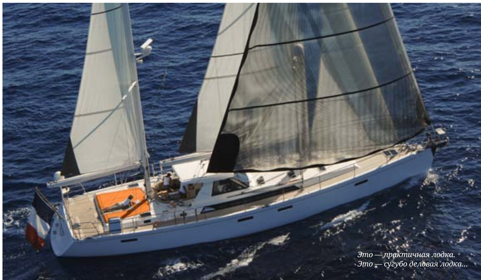
Это — практичная лодка. Это — сугубо деловая лодка...